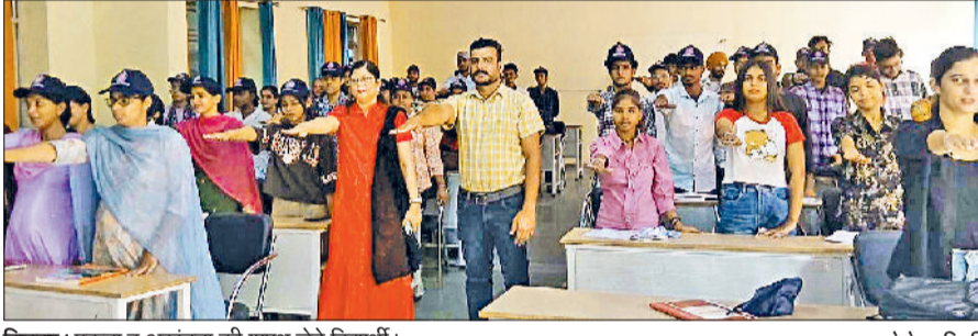
सिरसा। एकता व अखंडता की शाय लते विद्यार्थी।