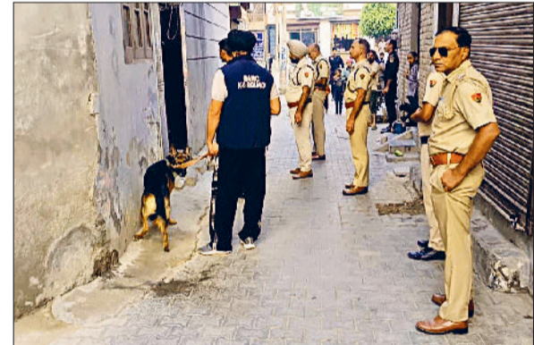
रतिया। क्षेत्र में अपराधियों की घरपकड़ को लेकर वैकिंग अभियान चलाते पुलिस कर्मचारी।

महत्वपूर्ण स्थलों पर विशेष निगरानी रखी। डॉंग स्ववायड और अन्य पुलिस कर्मियों ने संदिग्ध व्यक्तियों की पहचान की, उनकी गहन पूछताछ की और आवश्यकतानुसार तलाशी ली। यह अभियान रतिया