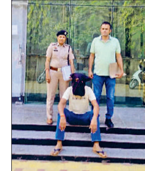
फतेहाबाद। पुलिस गिरफ्तार में पकड़ा गया आरोपी।