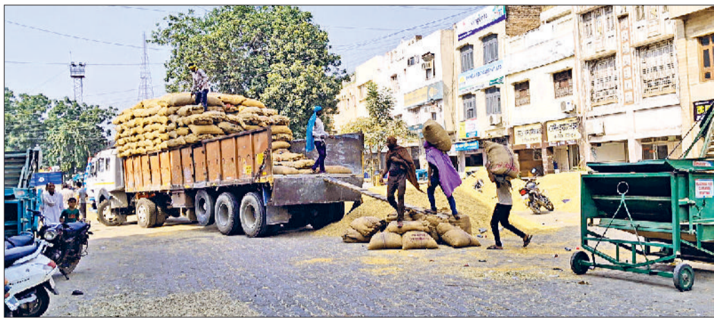
■ अनाज मंडियों ने लिफ्टिंग के काम में भी तेजी, तेजी से हो रहा उठान