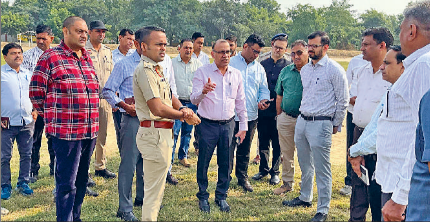
फतेहाबाद। मुख्यमंत्री के प्रस्तावित दौरा कार्यक्रम को लेकर विभिन्न स्थानों का निरीक्षण करते डीसी व एसपी।